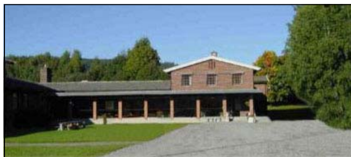
Briskeby skole og kompetansesenter

Fra Nasjonalt Senter for hørsel og psykisk helse i Oslo deltok både en psykiater og en psykolog på to av samlingene. Vi lærte mye om hvordan takle stress, strategier for mestring og ulike måter å kommunisere på.