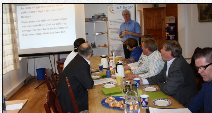
Gruppelederne i Bergen Bystyre på "skolebenken".

HLF Bergen inviterte gruppelederne i Bergen Bystyret til et møte om hørselshemming tirsdag 10.mai 2011 i Nygaten 3. Representanter fra 7 partier stilte på dette møte, noe som ga en representasjon på over 90% av Bystyret.