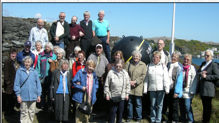
Glade og fornøyde turdeltakere ved Nordsjøfartsmuseet.

Likemannsarbeidet jobbes det jevnt og trutt med. Vi har som kjent åpent kontor 1 gang i måneden der medlemmer og andre kan stikke innom og få en prat og litt praktisk hjelp.