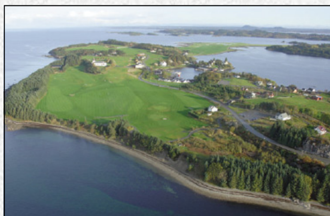
På tur til Askøy var vi blant annet på Herdla, som vi her ser fra luften. Flott natur og trivelig tur!

Vi håper årene fremover blir like aktive og at foreningen fortsatt er et møtepunkt hvor hørselshemmede kan møte hverandre over en kopp kaffe og få tilrettelagt informasjon og annet aktuelt via teleslynge og skrivetolking.