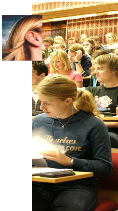
UiB –Lyd i undervisningsrom; UU -lyd"