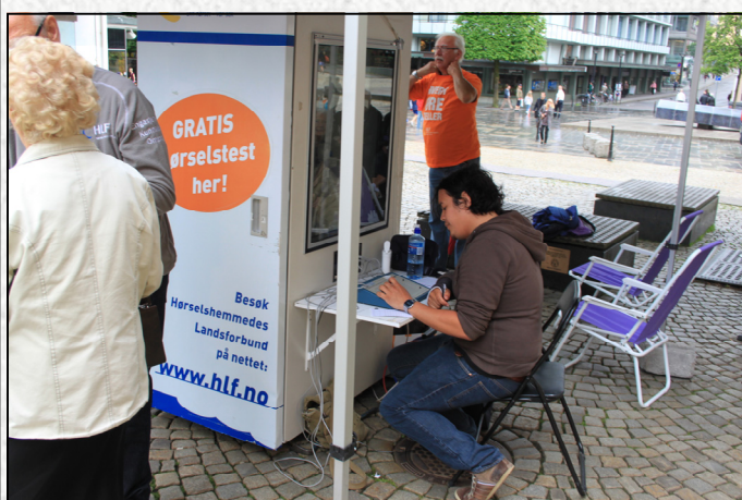
Gratis hørselstest under aksjonen "Hvert øre teller!" under Verdenskongressen 2012 hvor HLF Bergen stilte med frivillige.

Vel møtt på møter, turer, åpent kontor - og velkommen til å ta kontakt om det er noe du lurer på - kanskje du har lyst å delta aktivt i styret? Ta kontakt - vær et aktivt og glad medlem!