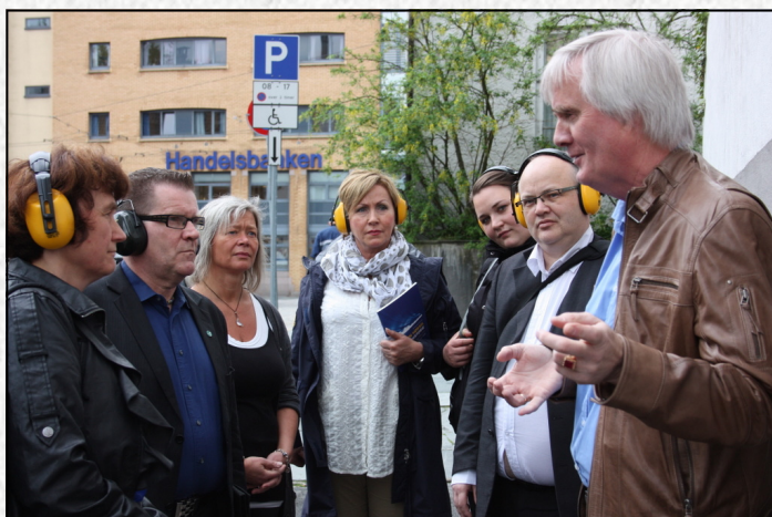
Bystyrepolitikerne på byvandring med HLF Bergen

Dette var svært lærerikt for politikerne, og vi har merket økt forståelse for hørselshemmede i kommunen i ettertid.