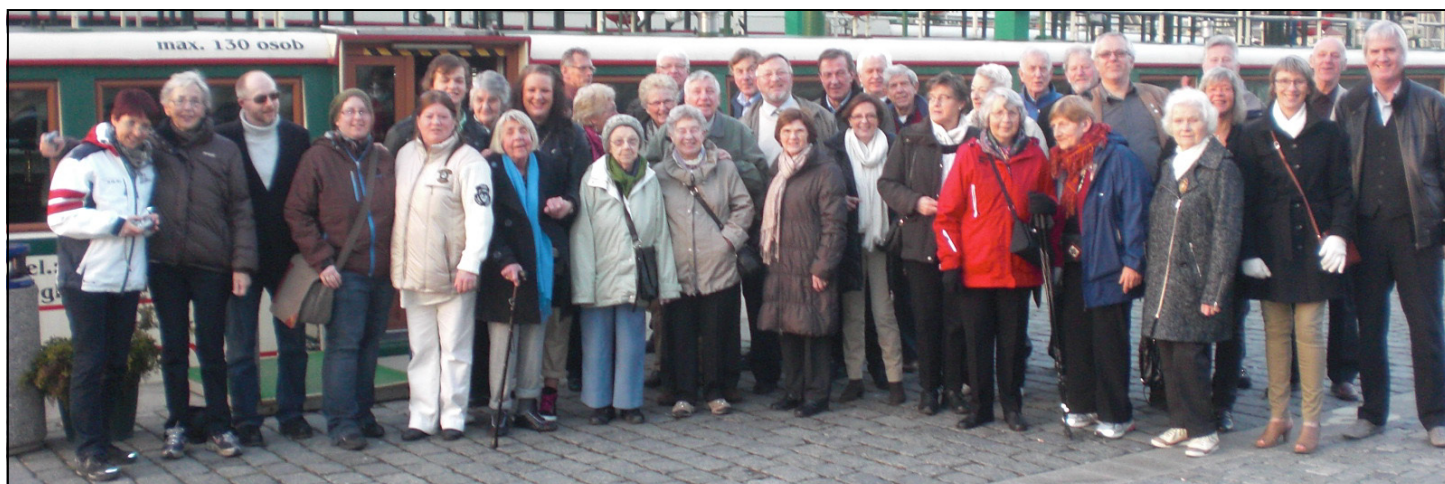
Fornøyde turdeltakere i Praha før vi går om bord på en båt for å delta på sightseeing/elvecruise på elven Moldau.