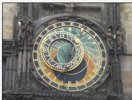
Den astronomiske klokken i Praha

Den vellykkede HLF BERGEN turen til Praha ble gjennomført 19.03.11 - 22.03.11. Vi hadde felles avreise, felles buss til hotellet i Praha. I Praha var vi blant annet ute og spiste sammen, vi hadde sightseeing i Praha med norsktalende guide, båttur på elven Moldau med mat og drikke. En uforglemmelig tur for de 36 glade deltakerne!