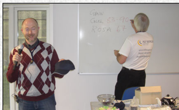
Fra utlodning på medlemstur til Voss lokallag