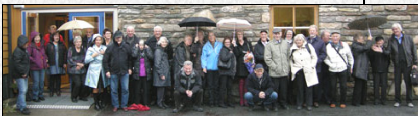
Enda flere glade turdeltakere - her fra tur til Osterøy hvor vi besøkte HLF Osterøy.