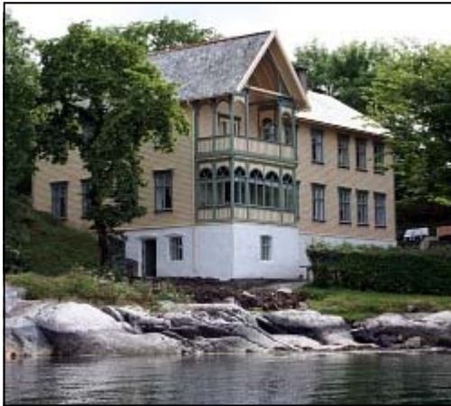
Eivindvik Fjordhotell i klassisk sveitservilla-stil ligger vakkert til ved sjøkanten.

Vi kikker innom den gamle landhandelen med utstillinger av ting som ble solgt i "gamle dager".