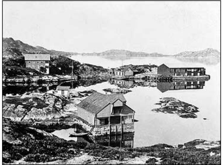
Skjerjehamn i glanstida ca 1899.

Tidene endret seg da transporten ble flyttet til landeveien, det ble stille og tomt på Skjerjehamn. Stillheten varte i mange tiår, men nå er den tiden forbi..